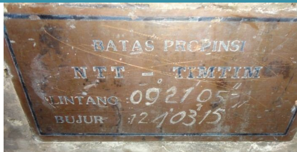
Foto : Estaka Markasaun Fronteira iha Naktuka tempu Holanda no Portugal.

husi postu TNI. Nune'e mós membru UPF menus fó impaktu labele halo patroliia durante 24 oras, no laiha fasilidade komunikasaun.