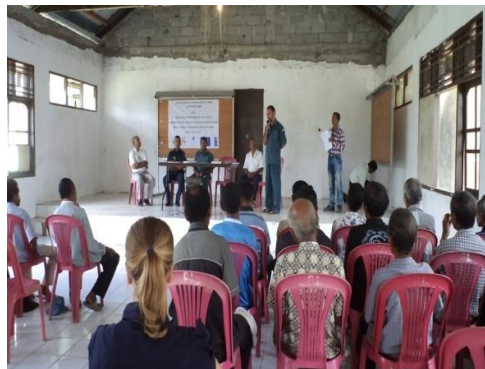
Foto : Dialogu entre Komunitade Aldeia Roin (Daisua) ho Komunitade suku Tutuluro

Rede Prevensaun no Responde Konfliktu (RPRK) Subdistritu Same Vila (Manufahi) fasilita dialógu entre comunidade aldeia Roin (Daur), Suku Daisua ho comunidade Suku Tutuluro ne'ebe durante tinan 1982 – 2012, laiha relasaun diak, tamba situasaun konfliktu ukupasaun Militar Indonesia nia ne'ebé halao torturasaun ba Komunitade hodi Resulta Komunitade balun kanek no ida mate. Ho Razaun ne'e Komunitade Aldeia Roin muda (Halai) Integra ba suku Daisua. Maibé liu husi Dialogu ne'e ba faze dahuluk ho rezultadu positivu parte rua iha konkordansia ba malu atu kontinua halo Dialógu ba faze II tuir kultura, ho objetivu atu comunidade Roin suku Daisua bele fila ba sira nia suku orijinal Tutuluro.