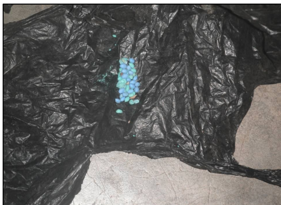
Veneno hanesan (PNTL)

Analiza dados insidenti tun depois de atividade eleisaun. Bele hetan relatóriu insidenti iha www.belun.crowdmap.com