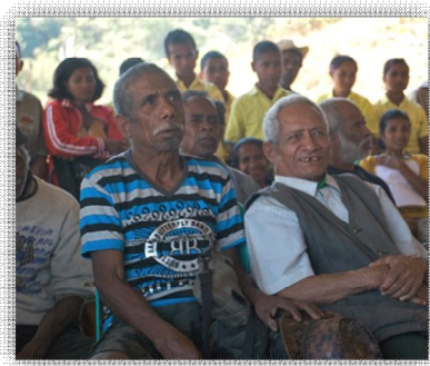
Aktivade dame "Oinsa atu Prevene Konfliktu iha Komunitade" Suku Fahinehan iha Manufahi

Programa AtReS implementa husi NGO Belun ho suporta husi União Europeia liu husi instrumentu ba Estabilidade no mós Governu Alemaña liu husi Organizasaun GIZ (Ajénsia nian ida ba Kooperasaun Internasional). Atu hetan infomasaun barak liu tan kona-ba programa AtReS ka atu hare publikasaun seluk, favor vizita: http://www.belun.tl