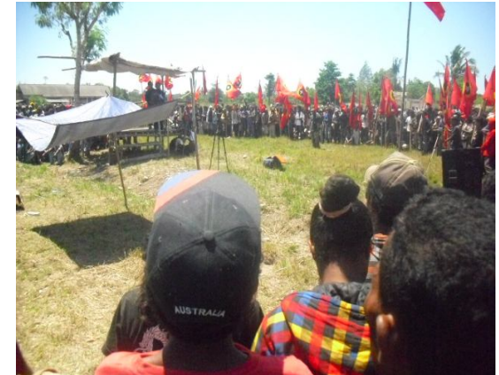
Foto : Evento Dialogu Prezidente da Republika ho grupu CPD-RDTL

Preokupasaun ne'e, sai atensaun husi Governu no Prezidente da Republika inklui Xefi Estadu Maior Jenerál F-FDTL, halo dialogu ho grupu CPD-RDTL no komidade Fatuberlihu hodi hare direta movimentu grupu CPD-RDTL nian. Rezultadu dialogu komidade Fatuberlihu mak fo sai statementu katak sira lakonkorda ho prezensa CPD-RDTL, maske nune'e CPD-RDTL mós mantein pozisaun atu nafatin konsentra iha Fatuberlihu. Rezultadu dialogu ne'e laiha solusaun no Governu foti ona desizaun ba Xefi Estadu Maior Jenerál F-FDTL hodi halo atusaun ba grupu CPD-RDTL, ne'ebé agora movimentu iha Subdistritu Fatuberlihu (Manufahi). Desizaun Governu ne'e, Xefi Estadu Maior Jenerál F-FDTL, deklara katak, atusaun ne'e laos fásil (Timor Post, 14/12/12).