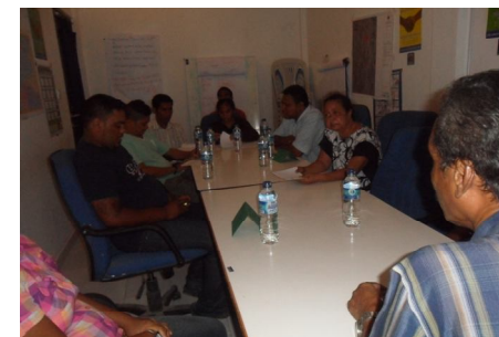
Foto : Belun fasilita mediasaun ba disputa rai ba disputante

Durante Novembru 2012, Sua Exselensia Prezidente da Republika hamutuk ho membru governu balu halo visita iha Distritu Manatutu, Baucau, Lautem, Viqueuque hodi rona diretamentu preokupasaun husi comunidade, nune'e sai hanesan razaun fundamental informa ba membru governu hodi halo asaun resposta ba preokupasaun comunidade. Vizita Sua Exselensia Prezidente RDTL ne'e sai hanesan mata dalan ba membru governu sira atu banati tuir hodi to'o iha comunidade.