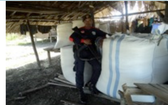
Postu Polisia iha area Halik, Sede Suku Beco hodi asegura comunidade.

Iha Distritu Covalima fulan ida ne'e, mosu preokupasaun husi comunidade liga bá movimentu grupu CPD-RDTL ne'ebé konsentra iha Suku Beco, Subdistritu Suai Vila (Covalima) hodi halo atividade kooperativa natar. Aktividade ne'e hamosu tensaun konfliktu ho comunidade tanba membru grupu CPD-RDTL balu halo ameesa comunidade ne'ebé lakohi koopera no fó apoiu bá atividade halo natar. Ligadu ho tensaun ne'e, Komandante Polisia Distritu Covalima tau ona postu Polisia iha Sede Suku Beco no iha area merkadu Beco hodi asegura comunidade. Nune'e mós Komandante Polisia halo aprosimasaun ho membru grupu CPD-RDTL, atu fila bá idak-idak nia Distritu hodi desenvolve kooperativa halo natar ho diak liu, maibé grupu CPD-RDTL mantein pozisaun hodi kontinua halao atividade iha Suai. Hatan ba preokupasaun ne'e, iha vizita Primeiru Ministru iha dia 12/4, iha Covalima hato'o mensagen katak "CPD-RDTL sira tenke bubar (hapara) atividade iha Suku Beco, bainhira lakohi sai, hau sei hasai obrigatorio husi fatin ne'eba". Parte seluk, maske atividade halo kooperativa laos ilegal, grupu CPD-RDTL prisija fó respeita ba comunidade ne'ebé hela iha fatin besik atividade.