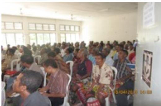
RPRK Distritu Oecusse realiza semináriu Distrital ho tema “Hametin Pas no Stabilidade Fronteira”,