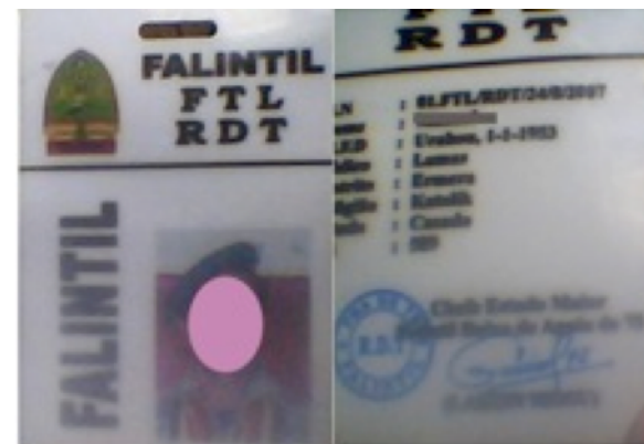
Kartaun identidade membru grupu Forsa FALINTIL, FTL RDT

Rezultadu monitorizasaun Belun hatudu katak, iha Subdistritu Hatolia (Ermera) relata grupu deskuñesidu balu halo influenza ba komunidade hodi involve iha grupu ne'ebé dehan, sei sai hanesan Forsa ho naran: "FALINTIL, Forsa Timor Leste (FTL) Republika Demokratiku Timorens (RDT)" ne'ebé sei troka FALINTIL-Forças da Defesa de Timor-Leste (F-FDTL). Grupu ne'e mós halo kobransa ba ema ne'ebé hakarak involve iha grupu ho osan valor US $ 13, hodi halo kartaun identidade hanesan membru grupu Forsa FALINTIL, FTL RDT. Hanesan consegra ona iha Konstituisaun RDTL artigu 146 ne'ebé dehan katak Forsa Defeza Timor-Leste iha ida deit mak F-FDTL. Tanba ne'e asaun husi grupu deskuñesidu sira ne'e, kontra konstituisaun RDTL.