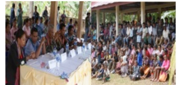
RPRK Sub-distritu Lautem realize seminariu liga ho tendensia konfliktu iha seitor seguransa., Judisial no ambiental.