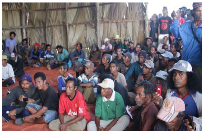
Grupú CPD-RDTL halo soru mutu ho representante Governu no PNTL

Liga ho asaun ne'ebé Polisia blokeia fatin balu, Kórdenador CPD-RDTL hasoru Sua. Exelénsia Prezidente RDTL atu Polisia hapara tiha atividade ne'ebé Polisia halo, maibé soru mutu ne'e laiha solusaun, Exelénsia Prezidente RDTL propoin atu grupu CPD-RDTL hasoru Vise-Premeiru Ministru (Timor Post 13/3/2013). Vise-Premeiru Ministru informa katak, desizaun governu mak liu husi rezolusaun, ne'ebé fó kompetensia ba PNTL halao iha Fatuberlihu. Iha rezolusaun ne'e preve ona katak governu prepara osan atu sosa produdu hare ne'ebé produs husi CPD-RDTL iha Fatuberlihu. Nune'e mós bainhira grupu CDP-RDTL iha inisiativa atu dezenvolve kooperativa, governu sei prepara osan hodi fó apoiu, tanba inisiativa kooperativa diak tebes (Suara Timor Loro Sae, 14/3/13).