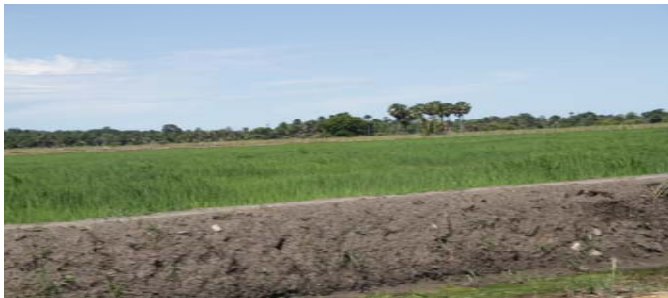
Natar ne'ebé grupu CPD-RDTL halo iha Subdistritu Fatuberlihu

Analiza dadus insidenti tun iha Feveireiru 2013, kompara ho insidente ne'ebé antes ne'e akontese. Bele hetan relatóriu insidenti iha www.belun.crowdmap.com