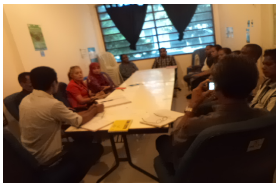
Belun Fasilita Mediasaun ba disputante disputa rai iha distritu Dili

Atividade ne'ebé halao iha nível Komunitária Iha fulan Maiu no Juñu 2013, iha fulan Maiu programa AtRes hala'o treinamentu Transformasaun Konfliktu ba Rede Prevensaun no Reponde Konfliktu iha subdistritu Laulara. No fulan Juñu konsultasaun regulamentu Tara Bandu no sosializasaun estabelesimentu munisipiu no lei kontra violénsia domestika iha subdistritu Fatuberlihu. distritu lima hanesan; Ermera, Likísia, Aileu, Baucau no Manatuto. Programa DAME hala'o asesmentu ba rede RPRK iha distritu sanulu resin ida ekluui distritu Dili no Oecusse halo hotu iha fulan Jullu no Agustu. Programa Rezolusaun Mediasaun no Disputa (RMD) fasilita mediasuan ba disputa rai iha distritu Dili iha fulan Juñu ba comunidade disputante sira. Maibé parte rua disputa la hetan solusaun no sira hakarak submete sira ninia kazu ne'e ba iha tribunal atu hetan justisa.