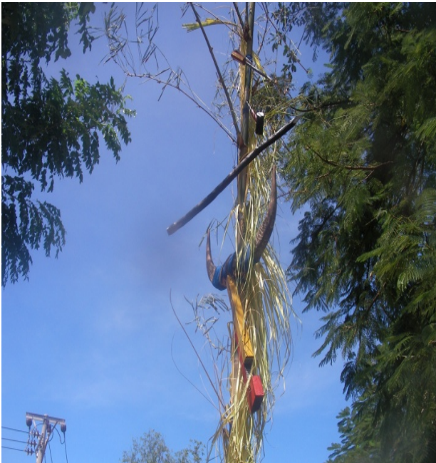
Tara Bandu iha subdistritu Laga distritu Baucau

Iha fulan Maiu mós atividade Tara Bandu hala’o husi RPRK Laga atu proteje meu ambiente hetan prezensa husi Sekretáriu Estadu Meiu Ambiente, Representante Sosiedade sivil, representante Polísia no F-FDTL inklui móa Belun.