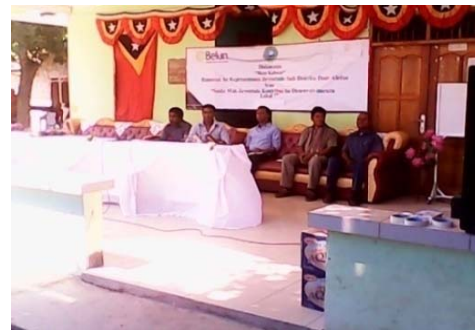
Orador ba enkontru Meja Kabuar iha Distritu Dili. Sekretariu Estadu SEFOPE, Prezidente CNJTL, Prezidente Komite 12 Nov, BELUN

Aktividade Nivel Nasionál Aktividade ne'ebé hala'o ona husi ekipa AtRes mak hanesan; Iha dia 20- 27 Outubru 2013 Hala'o atividade Round Table Meeting/Enkontru Meja Kabuar ho topiku " Saida mak Juventude halo hodi kontribui ba dezvoltimentu lokál" ba juventude iha Distritu lima; Distritu Ermera, Distritu Aileu, Distritu Baucau no Distritu Dili.