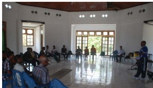
Partisipantis sira rona esplikasaun iha treinamentu

Ekipa MRD/Mediasaun Rezolusaun no Disputa, fasilita treinamentu iha distritu Manatuto konaba mediasaun ba Staff DTPSC no Konsellu do Suku mai husi Suku 6 hanesan Suco Sau, Aiteas, Ailili, Ma'abat, Cribas no Iliheu iha data dia 23 – 25 de Outubru de 2013.